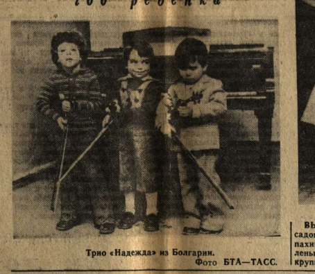
Трио «Надежда» из Болгарии.

Революционная буря в Иране подняла газетную зыбь на Западе. В Соединенных Штатах, например, иранская тема не сходила со страниц прессы. Выстрелы в генерала Гарани и атолл Матхари отозвались «Вашингтон пост». Недавно эта газета представила США в роли потерпевшего в Иране.