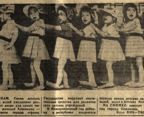
Десятки новых детских садов и асаей, школ и детских больниц. НА ШИМКЕ: концерт в честь города Хошимина.