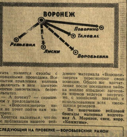
СЛЕДУЮЩИЙ НА ПРОВЕРКУ — ВОРОБЬЕВСКИЙ РАЙОН

Впечатляюще выглядят кормомехи и в колхозе имени Тельмана. Это — современное сооружение, сделанное по последнему слову техники. Обобщено оно колхозу в 45 тысяч рублей, но прибыль пока не принесло. Воле аг-