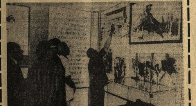
МАПУТУ. В музее Революции в столице Народной Республики Мозамбик студенты и экзипаты, рассказывающие о героической борьбе мозамбикского народа против португальских колонизаторов, за свободу и независимость, об этапах становления партии ФРЕТИМО, организатора и вдохновителя антиколониальной борьбы, боевого вождя народных масс. Представлены также экзипаты, отражающие коренные социально-экономические преобразования, проводимые партией и правительством республики за годы независимости. Они охватывают становление коллективных деревень, борьбу за ликвидацию неграмотности. Особое место отведено документам съезда партии ФРЕТИМО, намечавшего пути строительства социализма в республике.

Всего за последние три года в промышленности было ликвидировано 80 000 рабочих мест. Жертвами сокращения производства стали и 3 тысячи автомобильных строителей