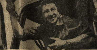
О ШЕВЧЕНКО, спец. корр. «Коммуны».

— Алло! Районный штаб! Принимте телефонграмму; за семнадцать часов в колхозе имени Тельмана заложено в траншею две тысячи тонн силоса. Задание перевыполнено. Завтра намерены утяжелить в мешелье.