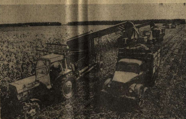
На снимках: Зеленая жатва в разгаре.

Вечером снова прибыли горячие термосы. И снова активисты из идеологического отряда коротко знакомы с тем, как идет дело, подбадривали участников ударной вахты. И снова убирали комбайны свои загоном. Скорость высокая, а сред низкий. Именно так сила косовина — хотелось механизаторам и темпы не сбавлять, и потерь не допускать.