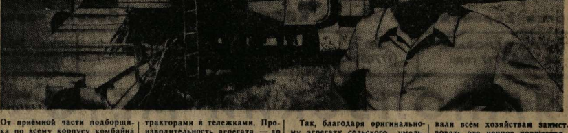
Текст в фото И. Голованова