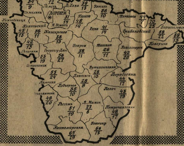
ПРИМЕЧАНИЕ К КАРТЕ. Числитель — процент выполнения плана копки сахарной свеклы. Знаменатель — процент выполнения плана общего объема заготовки. Данные на 21 сентября.