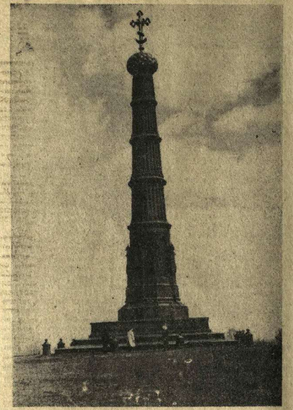
Через год, в сентябре 1980 года, исполняется 600 лет со дня Куликовской битвы, когда русские полки во главе с князем Дмитрием Донским одержали победу над монголо-татарами во главе под предводительством хана Мамая. Куликовская битва положила начало освобождению русского и других народов от монголо-татарского ига.