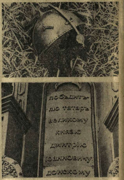
Сейчас на Куликовом поле идет подготовка к юбилею. Заключаются реставрация памятников старины. На снимке справа сверху: плен воина времен Куликовской битвы. На снимке слева внизу: фрагмент памятника. На снимке слева: памятник на Куликовом поле.