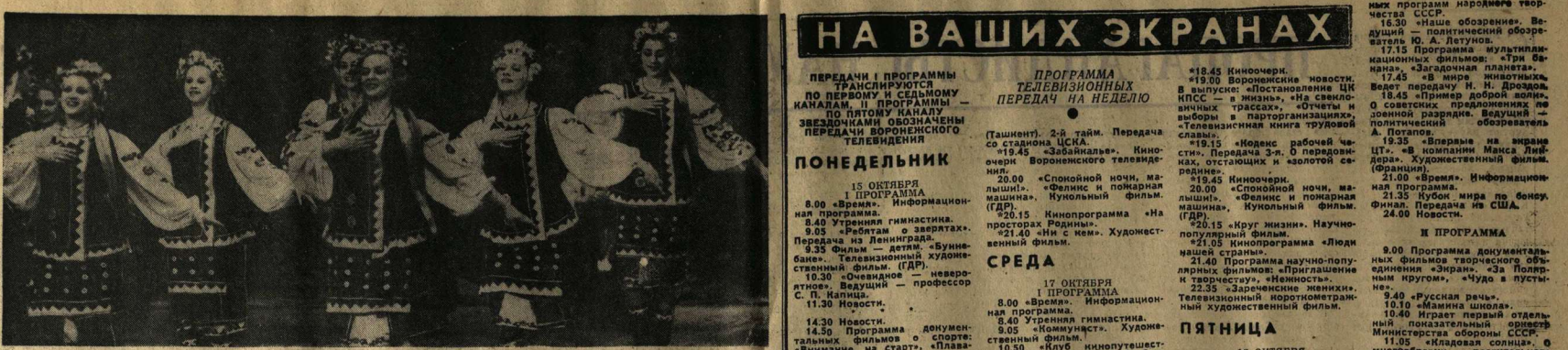
ТАНЦУЕТ АНСАМБЛЬ «КОСМЯНЕ», ДВОРЕЦ КУЛЬТУРЫ ИМЕНИ ЛЕНИНА.