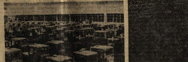
Тракторостроительный комбинат в городе Карлсруэ, построенный при техническом содействии Советского Союза. — филиал болгарского сельского хозяйства. Машиностроения, производит как комбайны, так и тракторы. В настоящее время инженеры и конструкторы Карлсруэ работают в тесном контакте с советскими коллегами, планируя производство тракторов мощностью 100-120 лошадиных сил.

«Весьма типичный вояк — многолетняя служба». По оценкам специалистов, это достаточное арсенал было достаточным, чтобы в воздухе летало полтора самолета, а арсеналом было достаточным, чтобы в воздухе летало полтора самолета, а арсеналом было достаточным, чтобы в воздухе летало полтора самолета.