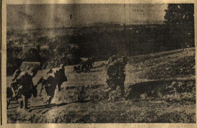
НА СНИМКЕ: 1944 г. Бой за Дукельский перевал в Карпатах, чехословацкие воины в наступлении.

Ялет по зарослям, не решаясь, однако, углубиться в лес.