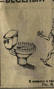
К вопросу о системе вова. Рис. И. Суворова.