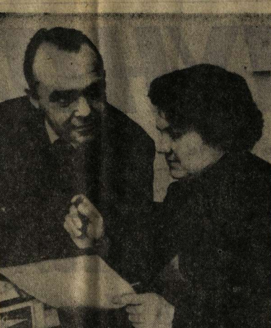
НА ИЗБИРАТЕЛЬНОМ участке № 13 Центрального района г. Воронежа, расположенном в здании медицинского института, ведется большая предвыборная работа. Составлены и проверяются списки избирателей, действует стол справок. В агитпункте хорошая наглядная агитация, литература, связанная с выборами.

Предстоящим выборам в Верховный Совет РСФСР и местные Советы посвящаются в эти дни рейсы агитпунктов по районам. Вечерние концертные выступления коллективов художественной самодеятельности районного Дома культуры и анисимовских предприятий.