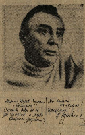
Дорогие друзья! Дорогие читатели! Спасибо вам за участие в съемке фильма «Особо важное задание»!