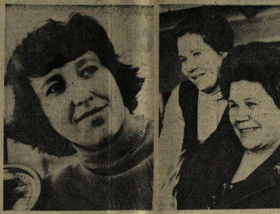
Вечера тысячи людей торжуются в мастерские, чтобы сдать в ремонт часы, телевизор, холодильник, другую бытовую технику, вызвать на дом мастера. Достаточно сказать, что только предприятия управления бытового обслуживания ежедневно выполняют более 60 тысяч различных заказов населения.

В нашей области в жилищно-коммунальном хозяйстве работает 27 тысяч, а в службе быта — 19 тысяч человек. Это огромная армия, создающая людям хорошие настроения, заботясь об улучшении их быта, создании комфорта.