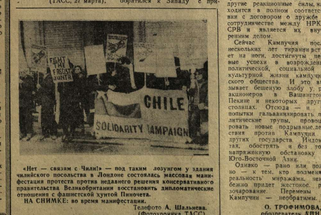
«Нет — святам с Чили!» — под таким лозунгом в здании чилинского посольства в Лондоне состоялась массовая манифестация протеста против недавнего решения консервативного правительства Великобритании приостановить дипломатические отношения с фашистской хунтой Пиночета. НА СНИМКЕ: во время манифестации.

«ПРОГУЛ ПОСЛЕ... АВАНСА» Под таким заголовком в «Коммуне» была опубликована корреспонденция, в которой говорилось о нарушениях трудовой дисциплины, прогулах, опозданиях на заводе строительных конструкций. Руководство завода поручило в соответствии с постановлением ЦК КПСС, Президиума Верховного Совета СССР, Совета Министров СССР и ВЦПС «О дальнейшем укреплении трудовой дисциплины и сокращения текучести кадров в народном хозяйстве», регламентировав документом условия производства, отгулов и увольнительных записок для сокращения потерь рабочего времени. Определили меры по повышению коэффициента загрузки оборудования, лучшего использования имеющегося парка. Реализация этих и других намеченных мероприятий будет способствовать более полному использованию на заводе производственных мощностей, повышению трудовой дисциплины.