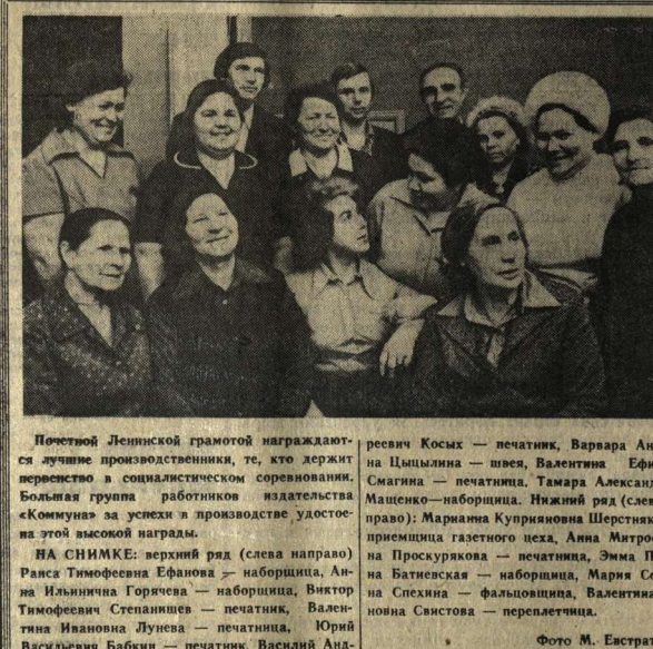
Почетной Ленинской грамотой награждаются лучшие производственные, те, кто держит первенство в социалистическом соревновании. Большая группа работников издательства «Коммуна» за успехи в производстве удюственно высокой награды.