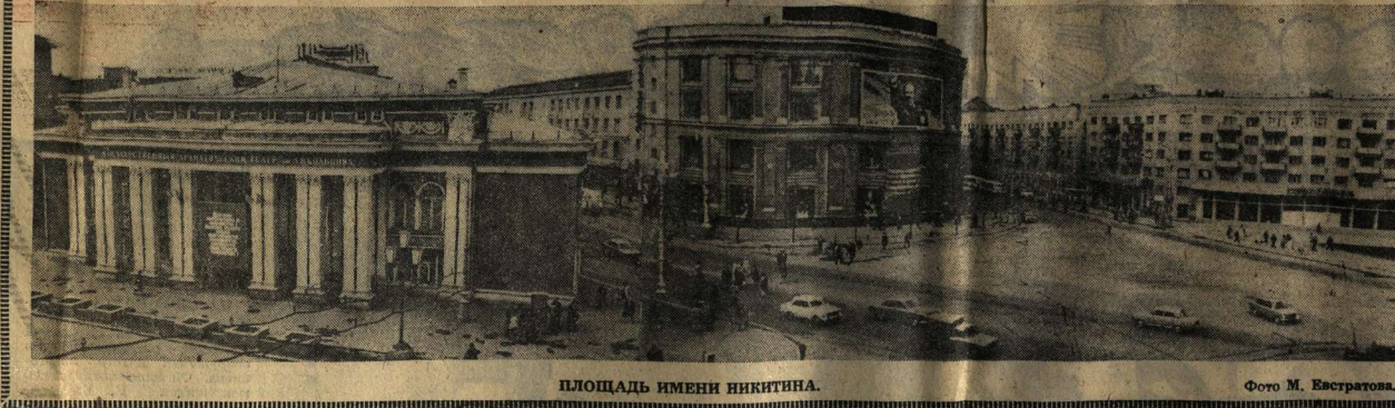
ПЛОЩАДЬ ИМЕНИ НИКИТИНА.