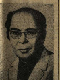
Эрве Базен, писатель, общественный деятель (Франция).