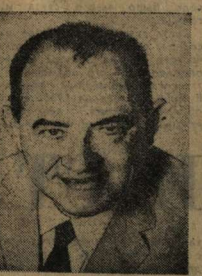
Ле Зуан, Генеральный секретарь ЦК Коммунистической партии Вьетнама.