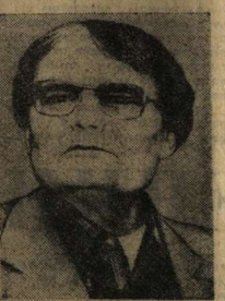
Мигель Отеро-Сильва, писатель, общественный деятель (Венесуэла).