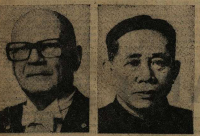
Урхо Калевас Кекконен, Президент Финляндской Республики.

Абдурахман аль-Хамиси — писателю, общественному деятелю (Арабская Республика Египет).