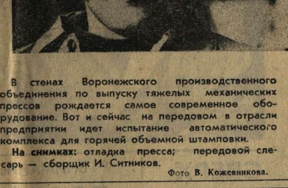
В стенах Воронежского производственного объединения по выпуску тяжелых механических прессов рождается самое современное оборудование. Вот и сейчас на передовом в отрасли предприятии идет испытание автоматического комплекса для горячей объемной штамповки.