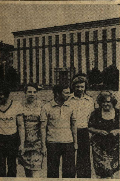
Юноши и девушки, запечатленные на этом снимке, работают на опытно-экспериментальном заводе «Росатомремонт». И в том, что их коллектив успешно выполняет все планы и принимает социалистические обязательства, постоянно выполняемые классные мастера в республиканском соревновании родственных предприятий, есть немалая их заслуга.

Фальшь буржуазной пропаганды лучше всего опровергает сама же буржуазная действительность. Кто, как не политики и идеологи США, громко и назойливо кричат о «справках человека», о прелестях американской «свободы», а в действительности в США, президент страны прибегает к тактике выкуривания рук для того, чтобы сорвать поездку американской молодежи на «Олимпиаду-80». Как бы ни объясняли свои противоречивые действия Картер и его администрация, в основе их лежит злоба скрытая зависть международных контактов молодежи.