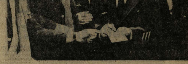
Автотранспортные предприятия Центрального Черноземного территориального управления для обслуживания Олимпиады-80 направили 60 автомобилей и сто человек водительского состава.