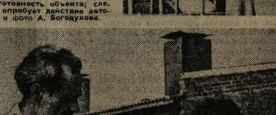
На СНИИМАС: сверху — общий вид блока; в центре — главный инженер А. К. Михайлов...