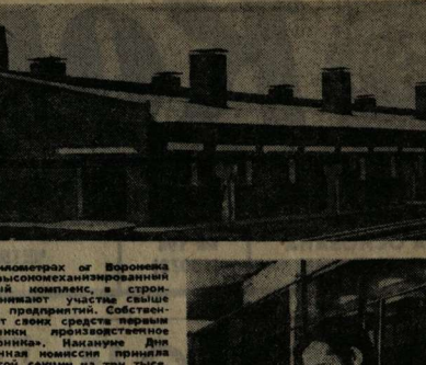
В нескольких километрах от Воронежа возмощены высокотехнологичный самоотворочный комбайн...