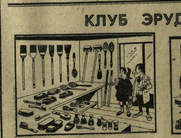
В ХОЗЯЙСТВЕННОМ МАГАЗИНЕ