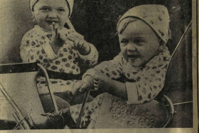
НА ПРОГУЛКЕ — БЛИЗНЕЦЫ.