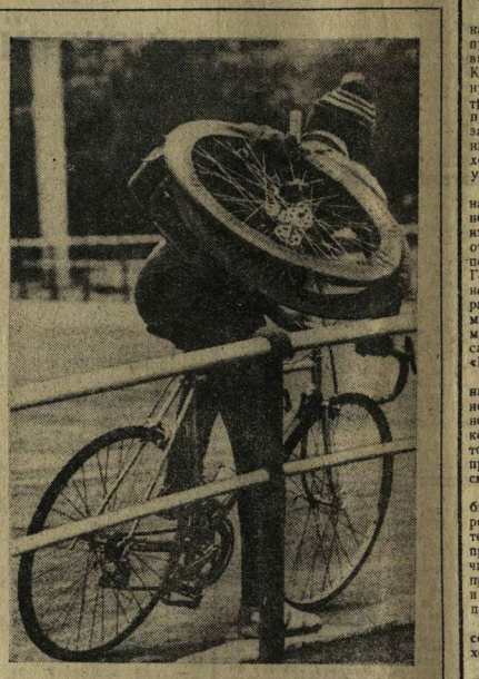
СПОРТИВНЫЕ ХЛОПОТЫ.