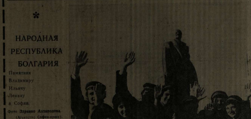
Владимир Ильич Ленин в Софии.