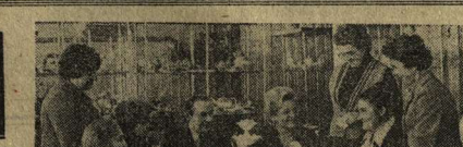
Группа специалистов Ленинградского фарфорового завода имени И. М. Губкина в азербайджанском городе Гяндже и организаторы первого в СССР промышленного производства тонкостенных изделий из жестированного фарфора устроена Государственной премии СССР 1980 года.

СССР Л. И. Брежнев, член Политбюро ЦК КПСС, министр иностранных дел СССР А. А. Громыко, секретарь ЦК КПСС М. В. Змигиня, другие официальные лица.