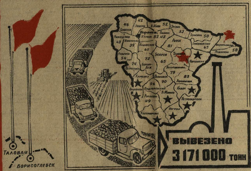
Примечание к карте: цифры обозначают процент выполнения общего объема закупок свеклы на 17 ноября, звездочками от отмечены районы, выполнившие социалистические обязательства 1980 года.