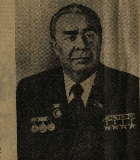
Леонид Ильич Брежнев

ЦЕНТРАЛЬНЫЙ КОМИТЕТ КПСС ПРЕЗИДИУМ ВЕРХОВНОГО СОВЕТА СССР СОВЕТ МИНИСТРОВ СССР