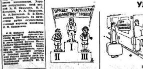
ПРИВЕТ УЧАСТНИК! НАШЕГО ПРОСЛАВЛЕННОГО ПЕРВОМАЯ