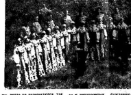
Ведущий и участники конкурса.

Желаю всем участникам конкурса творческих успехов и творческих успехов.