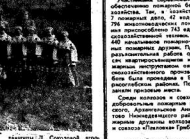
Ведущий и участники конкурса.

Желаю всем участникам конкурса творческих успехов и творческих успехов.