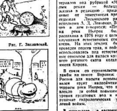
Рис. Г. Завьялова.