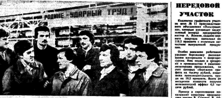
В цехе «Родина» ударный труд.

Летние трудовые показатели работников предприятий промышленности и строительства Ленинграда за первый квартал 1983 года показывают, что многие из них работают сверх плана.