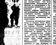
Новые... Харьковчане в Воронеж...