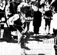
Варваров... Харьковчане в Воронеж...