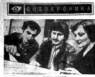
Самостоятельная программа артиста... (Caption text describing the performer in the image above)