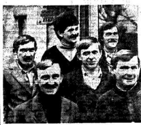
КАК ЖИВЕШЬ, БРИГАДА?

— Воронеж на реконструкцию, — с заветом направили в те годы, когда в стране не было ни одного здания, которое бы не подлежало сносу. Штукатурка, кирпич, бетон, а иногда даже и арматура — все подлежало сносу. Вспомните, какой была тогда Воронежская область! Вспомните, какой Воронеж тогда казался городу. Число рабочих было не сопоставимо с числом жителей. Многие рабочие жили в бараках, в землянках, в земляных землянках. Многие рабочие жили в землянках, в земляных землянках. Многие рабочие жили в землянках, в земляных землянках.