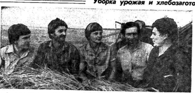
Уборка урожая и хлебозаготовки