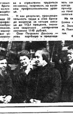
Члены бригады на работе.