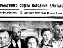
Портрет одного из участников конференции колхозников.

В работе конференции участвовали делегаты из 18 районов области. Конференция открылась в 10 часов утра.