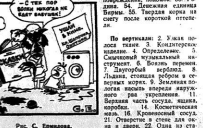
Рис. С. Эрнста.