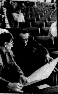
Вот так выглядят представители «Зеленого движения». На фото — представители экологической организации «Экологический союз» в г. Москва. Они обсуждают вопросы экологической безопасности и защиты окружающей среды.