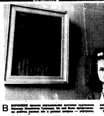
В Воронежском музее истории города...