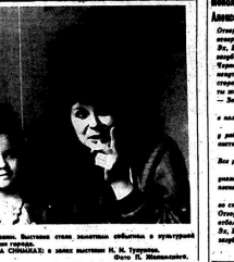
На снимках: в зрительном зале музея...