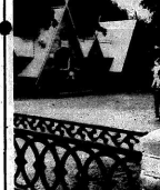
В первый летний месяц многие жители разных районов страны приехали в лагерь дружбы и труда в Воронежской области. Многие из них — ветераны Великой Отечественной войны, а некоторые — ветераны Афганской войны.