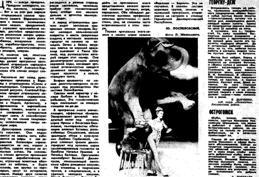
Первая программа циркового представления «Слоны, джигиты, гимнасты...» в Воронежской области. На сцене выступают артисты циркового ансамбля. Зрители наслаждаются зрелищем и аплодируют артистам.