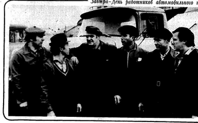
Забра-Дей работников автомобильного транспорта