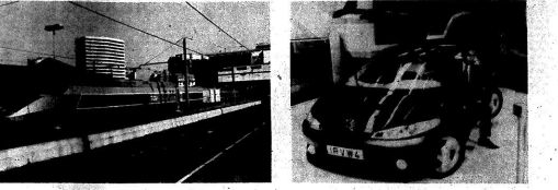
Видео: РАЙДЕЛ, видеоцентр «АВТ»

Видео: РАЙДЕЛ, видеоцентр «АВТ». Изображение показывает крупный транспортный автомобиль, движущийся по дороге. Видеозапись сделана с высоты, что позволяет рассмотреть детали конструкции и движение транспорта.