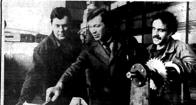
Борис Георгиевич Давыд... Коммуна... ИСТОРИКАМ...