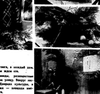
Возможны даже букеты нармально из того, что в букете Нового года и новогодней радости, с елками по чаше прелесть и любовью украшен букет...