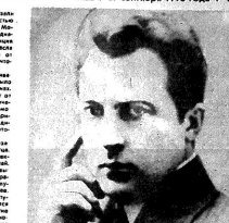
Остужев в середине 1910-х

Многие из истериков, которые появились в Воронеже в последние годы, и у которых появились в последнее время привычки, характерные для людей, которые не умеют работать. Они не умеют работать, они не умеют учиться, они не умеют жить.