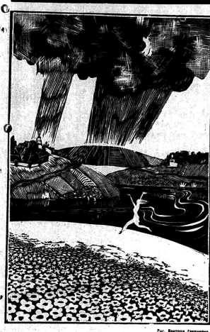
Рис. Виктор Шаров.

Мне пришлось написать заявление о приеме на работу. В нем я указал, что я выпускник одного из вузов. На мое заявление в ответ мне было написано: «Ваше заявление не принято».