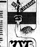
Ар. Курьер, парализованная последняя...