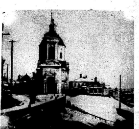
И. ХОДАНОВ. Литературная запись В. ЧЕМАЛОВА.