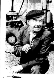
Поле: день за днем

Лидеры Комсомола в гостях у работников на бывшем заводском дворе № 4 в г. Воронеж. В этот раз в гостях у работников завода № 4 в г. Воронеж. В этот раз в гостях у работников завода № 4 в г. Воронеж.