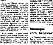
Милиция города берет?

Слова издали в программе «Общая линия» телевидения. В программе «Общая линия» телевидения. В программе «Общая линия» телевидения.