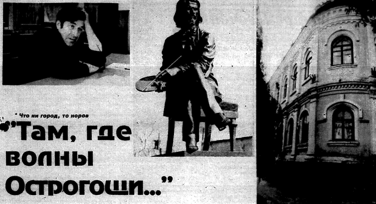
«Что ни город, то порог»