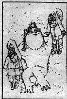
- Ну, вы знаете, коллега, это еще по научной факти!

А если в путевках речка Запорожье лучше всех разоблачил Осетия Смирнова: