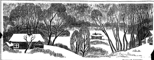
Рисунки В. Гаврилова.