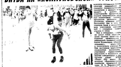
Многие из владельцев легковых автомобилей... платят за проезд... на платной трассе...