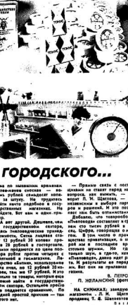
На снимках: заездники...