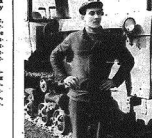
У сладкого сахара соленые корни