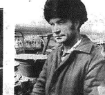
У сладкого сахара соленые корни