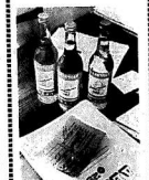
С. Марулюк.